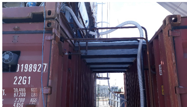
Plate-forme de maintenance

Nous avons également mis en service l'écluse rotative en bout de cycle.