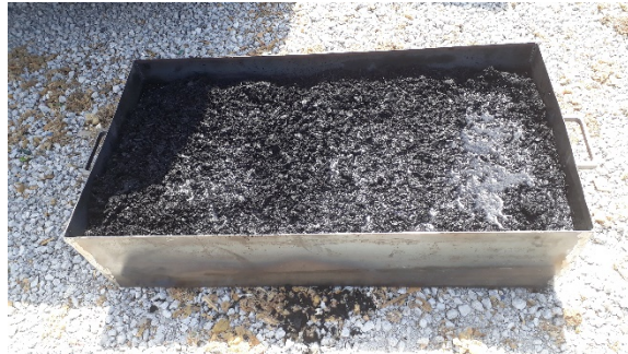
Char récupéré sous l'écluse

La dernière semaine de Juillet, nous avons procédé à la recette des modifications et procédé à 1 chauffe d'intégration, et 1 chauffe procédé complète, tous les systèmes en fonctionnement.