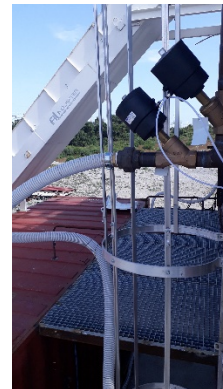
Sortie Pompe à vide